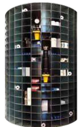
Rullo interno macchina

*Grafiche personalizzabili su richiesta del cliente.