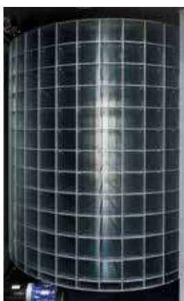
Rullo interno macchina