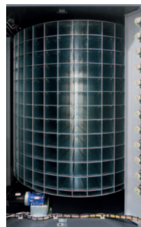
Rullo interno macchina

*Grafiche personalizzabili su richiesta a pagamento.