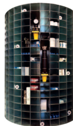
Rullo interno macchina

*Grafiche personalizzabili su richiesta a pagamento.